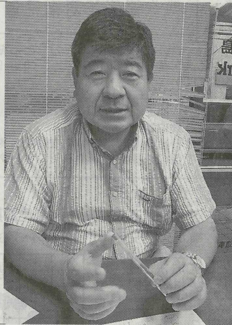
三島の水を守る市民活動が始まり。「富士山は湧水を供給する母なる山」

地元では、登録後の経済効果を期待しています。美しい富士山にどのようなセーフティネットを構築して次世代に引き継いでいくのか。総合的、長期