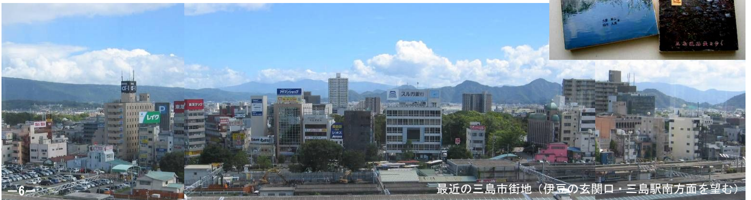
最近の三島市街地 (伊豆の玄関口・三島駅南方面を望む)