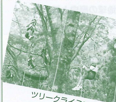
ツリークライミング体験