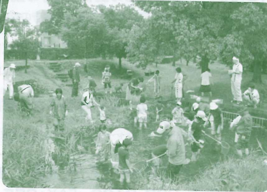
源兵衛川の水辺観察会