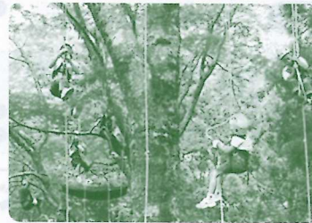
ツリークライミング体験