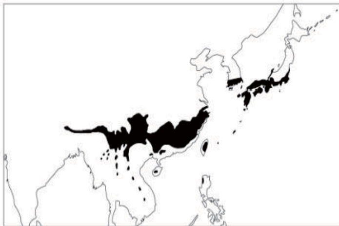
東アジアに広がる照葉樹林