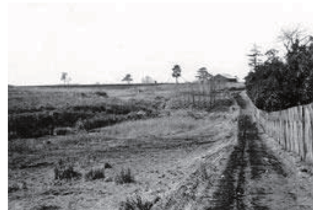
大正5年の景観（96年前）