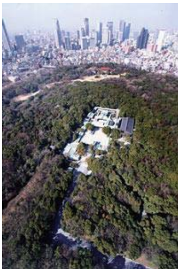
上空からの明治神宮(ふる里の森)