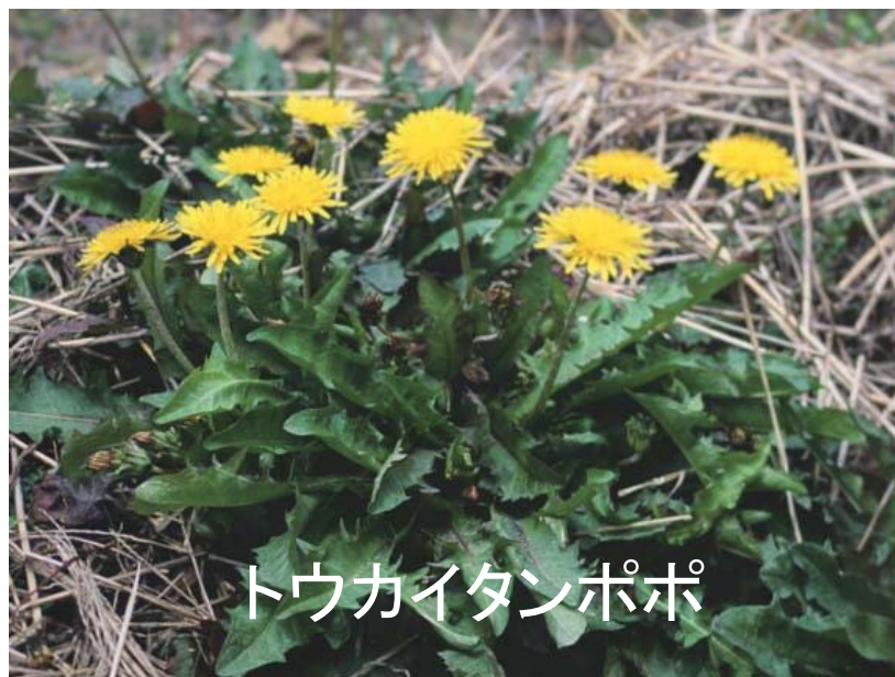
トウカイタンポポ