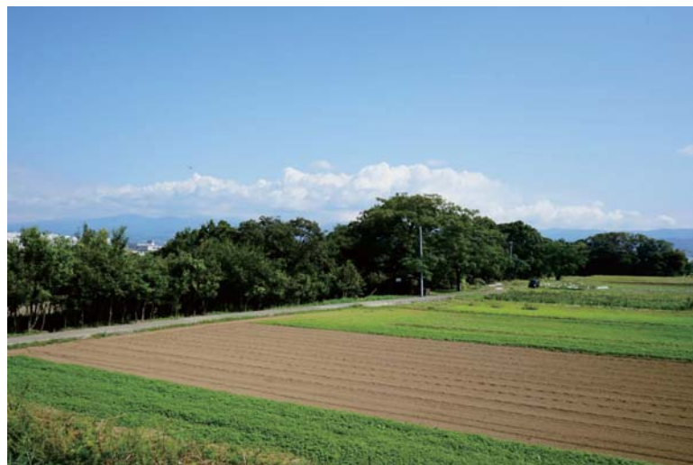
河畔林の景観(松毛川)