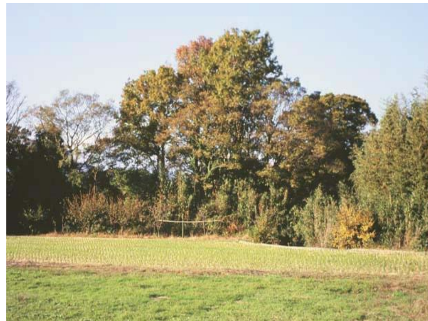
河畔林の代表種 エノキ