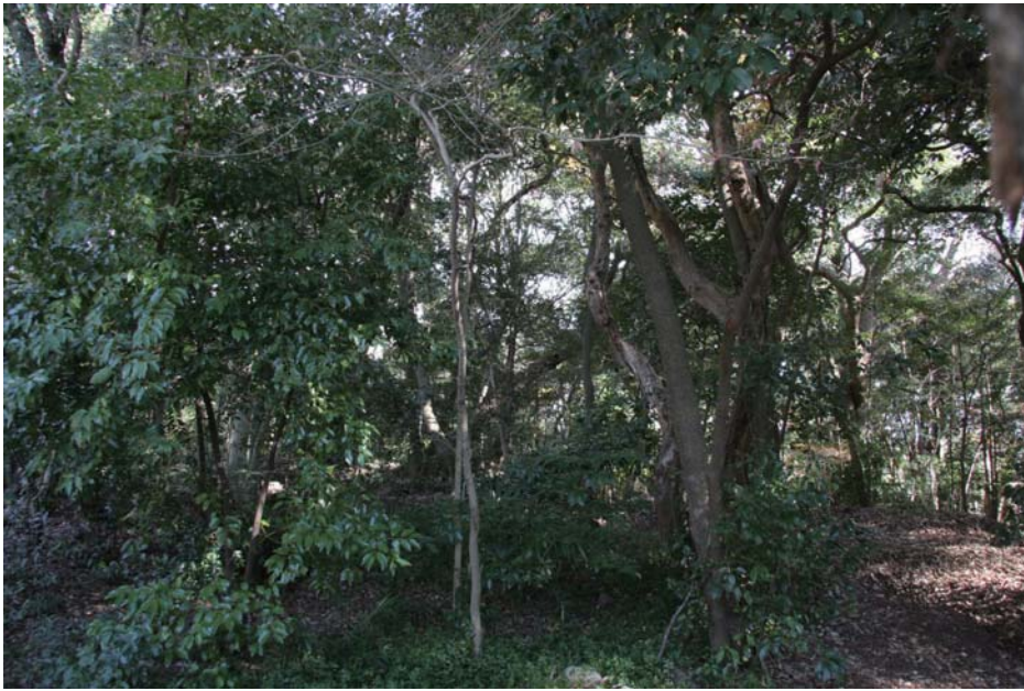
照葉樹林 ブナ科の世界