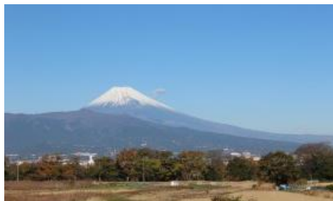
富士山の景観美と千年の森