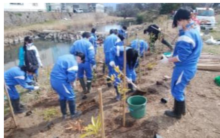
松毛川での植林作業